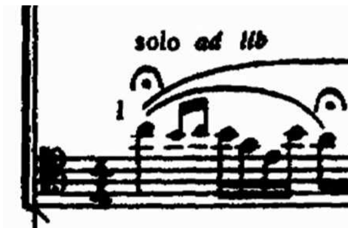
Strawinsky. Solo de fagot del comienzo de la Consagración de la primavera. Partitura

La disección en frecuencias de una señal dada se realiza por medio de un algoritmo conocido como la transformada de